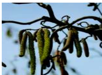
CORYLUS AVELLANA CONTORTA