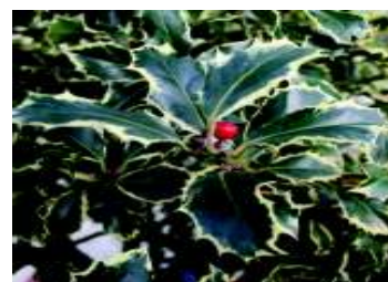
ILEX AQUIFOLIUM AUREA MARGINATA