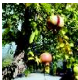
PUNICA GRANATUM NEIRANA