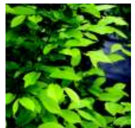
CARPINUS BETULUS PYRAMIDALIS