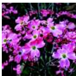
CORNUS FLORIDA RUBRA