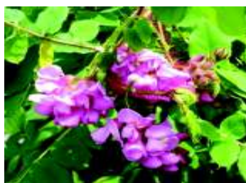
ROBINIA HISPIDA ROSEA