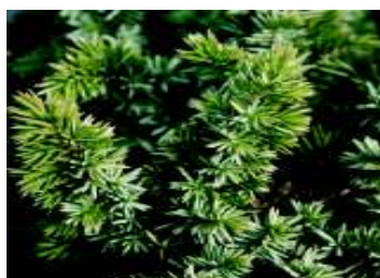
J U N I P E R U S BLUE PACIFIC