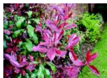
PHOTINIA X FRASERI RED ROBIN