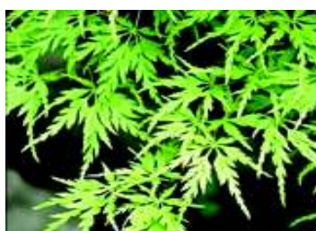
ACER PALMATUM SEYRIU