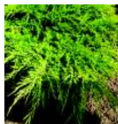
J U N I P E R U S OLD GOLD