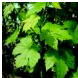
VITIS VINIFERA TREBBIANO