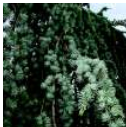
CEDRUS ATL.GLAUCA PENDULA