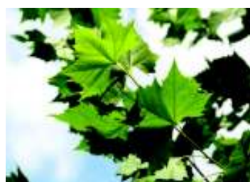
PLATANUS X ACERIFOLIA