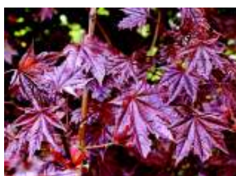
ACER PLATAN.CRIMSON SENTRY