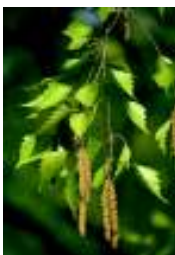
BETULA VERRUCOSA ALBA