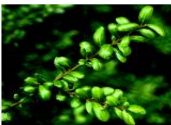
I L E X CRENATA CONVEXA