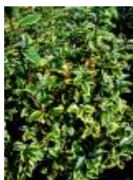
ELAEAGNUS X EBB.GILT EDGE