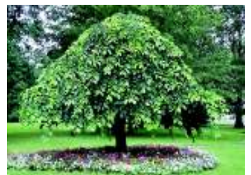
ULMUS GLABRA PENDULA (MONTANA P.)