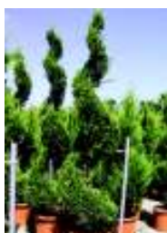
CUPRESSOCYPARIS LEYLANDII CWG