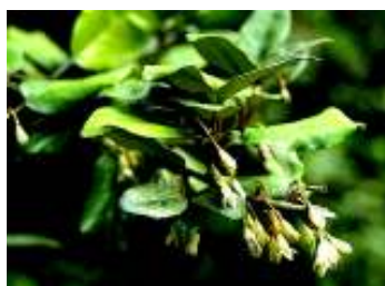
ELAEAGNUS X EBBINGEI