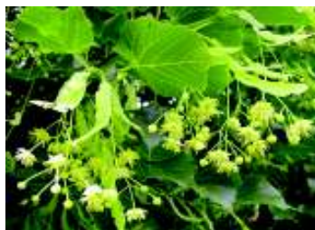
TILIA HYBRIDA ARGENTEA