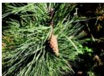
PINUS NIGRA AUSTRIACA