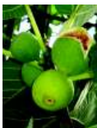
FICUS CARICA PORTOGALLO