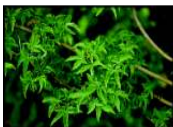
ACER PALMATUM SHISHIDASHIRA