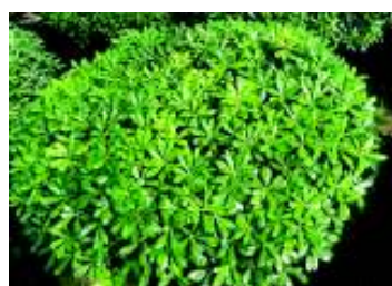
PITTOSPORUM TOBIRA NANUM