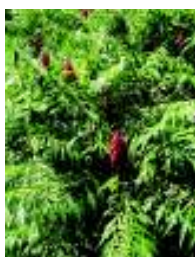
RHUS TYPHINA DISSECTA