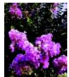
L A G E R S T R O E M I A INDICA