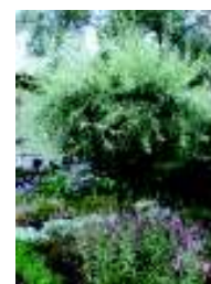
PYRUS SALICIFOLIA PENDULA