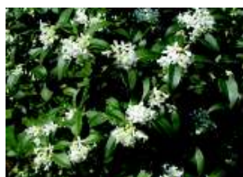
OSMAREA X BURKWODII