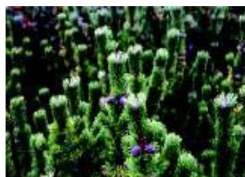
PINUS MUGO MUGHUS