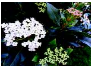
VIBURNUM TINUS EVE PRICE