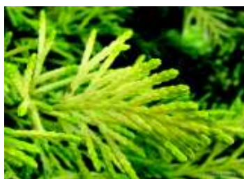
CUPRESSOCYPARIS LEYLANDII GOLD RIDER