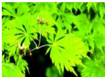
ACER JAPONICUM ACONITIFOLIUM