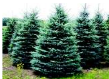
PICEA PUNGENS GLAUCA