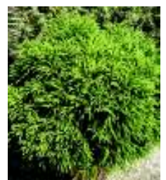
CRYPTOMERIA JAP.GLOBOSA NANA