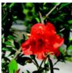
PUNICA GRANATUM FLORE PLENO