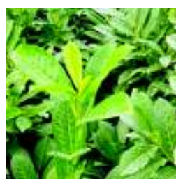
PRUNUS LAUROCERASUS NOVITA