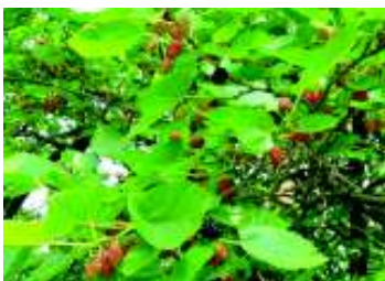
MORUS ALBA PENDULA